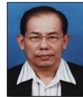
EN. LING KON KING (AHLI)